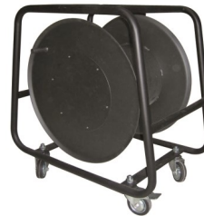
EM100 - EM 100R