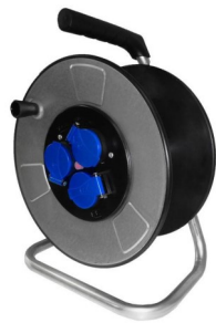
EM050 - EM50P